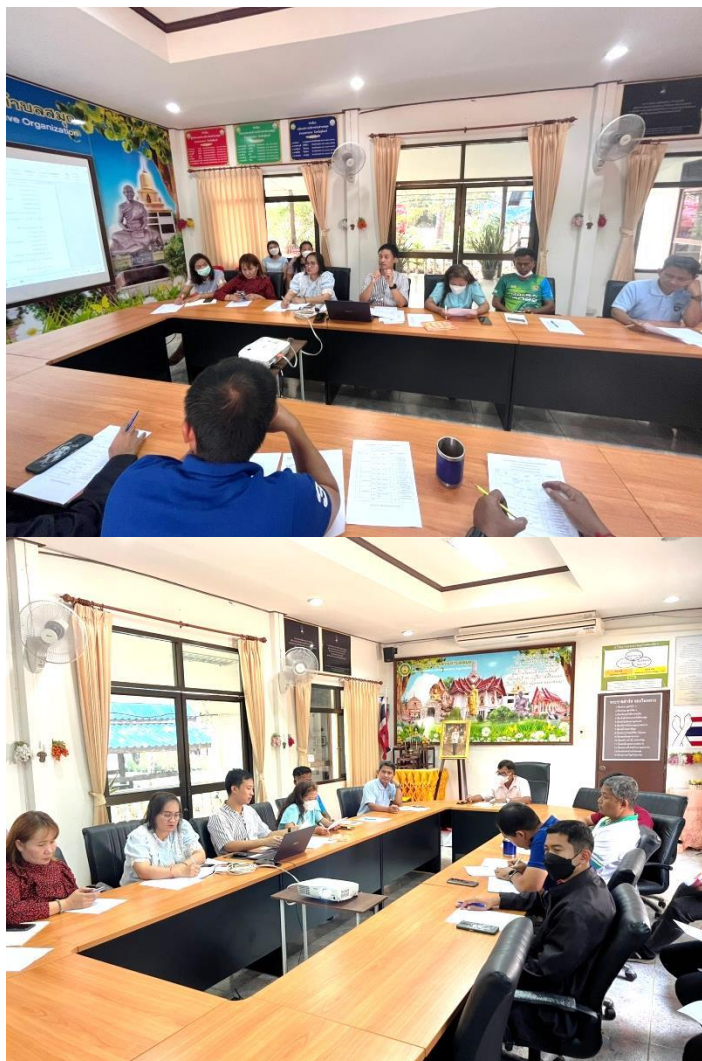
การประชุมชี้แจงสร้างความรู้ความเข้าใจหลักเกณฑ์การประเมินฯ ในปี ๒๕๖๖ เมื่อวันที่ ๓๐ มกราคม ๒๕๖๖